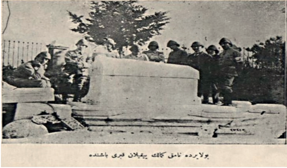
Resim-2: Bolayır'da Namık Kemal'in Yıkılan Kabri Başında Çekilen Fotoğraf 8

Çanakkale harp sahasını ziyaret eden heyette bulunan şairlerden olan Mehmet Emin (Yurdakul) de Çanakkale cephesinden vatanî şiiirlerle dönmiştir. 1897 Osmanlı-Yunan Savaşı ile Türk şiiirinde harp edebiyatı anlayış ve duyarlılığını başlatan Mehmet Emin, Çanakkale cephesinin ruhunda bıraktığı izleri “Ordunun Destanı” isimli şiiirle Çanakkale Kahramanlarına ithaf etmiştir. 9 “ Ey Mustafa Kemallerin aziz yeri! ” mısrasını içeren bu eser, aynı zamanda Mustafa Kemal isminin geçtiği ilk şiiir olması bakımından Türk edebiyatında ayrı bir öneme sahiptir. Şair 1916 yılında tamamladığı “Orduya Selam” isimli şiiirde de Çanakkale’de başarı ve cesaretle çarpışan Mehmetçiği büyük bir saygı ile yüceltmıştır.